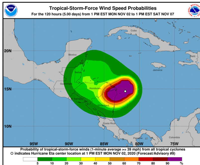
Gráfica 3. Cono de la probabilidad de la fuerza de los vientos de la tormenta tropical ETA para los siguientes días. NHC-National Hurricane Center 2 de noviembre de 2020. Hora 13:00 HLC.

Por otra parte, de acuerdo con el pronóstico para Oleaje en el Caribe del CIOH (Centro de Investigaciones Oceanográficas e Hidrográficas) en el Occidente de San Andrés y Providencia se podrían presentar alturas de ola entre 3.0 y 3.5 m durante el día martes (2 de noviembre), vientos con componente del suroeste con intensidad entre los 60 y 65 km/h, como se puede evidenciar en la figura presentada a continuación.