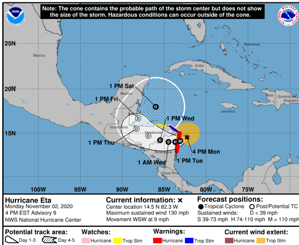
Gráfica 2. Cono de la posible trayectoria de la tormenta tropical ETA para los siguientes días. NHC-National Hurricane Center 2 de noviembre de 2020. Hora 16:00 HLC.