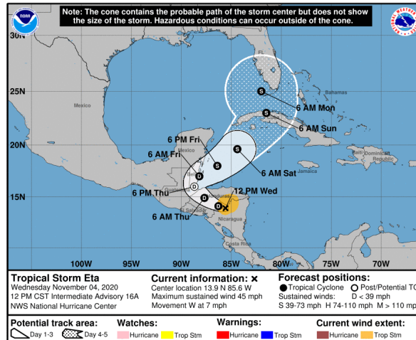
Gráfica 2. Cono de la posible trayectoria del huracán Eta para los siguientes días. NHC-National Hurricane Center 4 de noviembre de 2020. Hora 13:00 HLC.