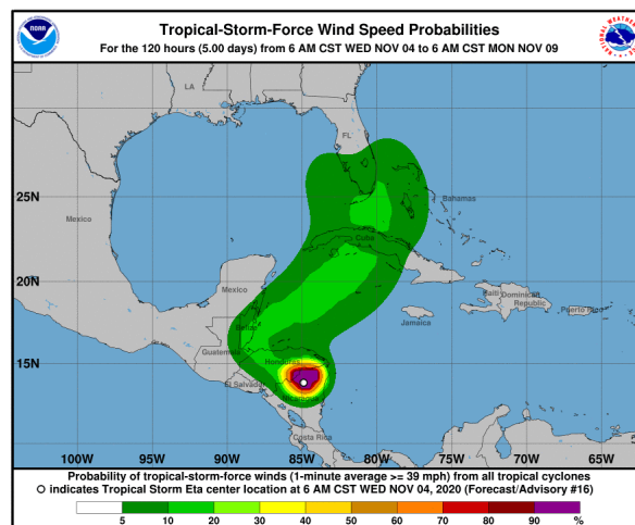
Gráfica 3. Cono de la probabilidad de la fuerza de los vientos del huracán Eta para los siguientes días.

Cualquier inquietud adicional relacionada con éste comunicado, podrá consultarse con el meteorólogo de turno al celular 3208412346 o al teléfono (031)-3527160, extensión 1334 de la ciudad de Bogotá D.C.