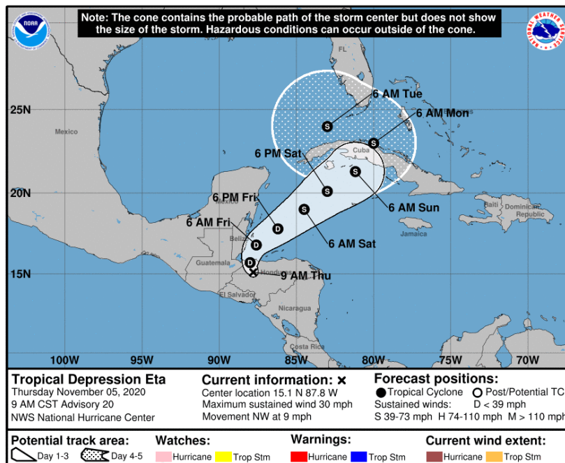
Gráfica 2. Cono de la posible trayectoria del huracán Eta para los siguientes días. NHC-National Hurricane Center 5 de noviembre de 2020. Hora 10:00 HLC.

Por otra parte, de acuerdo con el pronóstico para Oleaje en el Caribe del CIOH (Centro de Investigaciones Oceanográficas e Hidrográficas) en el Occidente de San Andrés y Providencia, se podrían presentar alturas superiores a los 2.0 m durante el día jueves (5 de noviembre), como se puede evidenciar en la figura presentada a continuación. En el área continental recomendamos seguir manteniendo las alertas, especialmente en zonas de alta pendiente ubicadas en las inmediaciones de la Sierra Nevada de Santa Marta, en sectores del sur de La Guajira y norte de Cesar y Magdalena donde son posibles crecientes súbitas y deslizamientos de tierra.